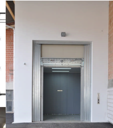
neuer Warenlift mit überdachter Andockstation für Lastwagen